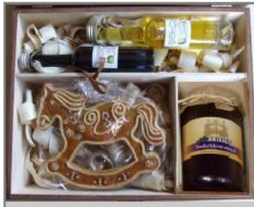
DM4 – 5.650 Ft