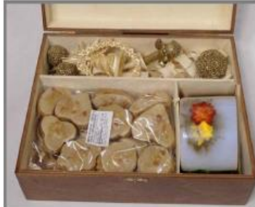
DM1 – 4.990 Ft