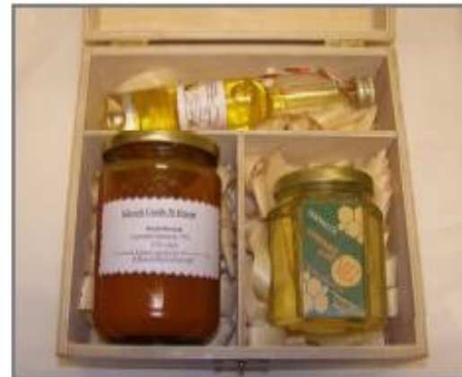
KD1 – 4.350 Ft