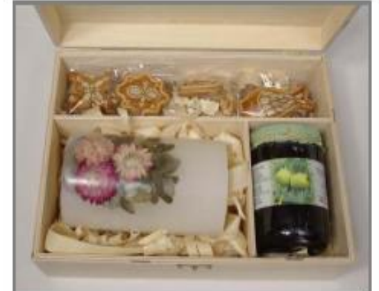
DM3 – 5.940 Ft