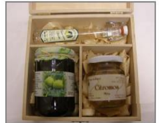
KD2 – 4.960 Ft