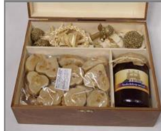
DM2 – 5.140 Ft