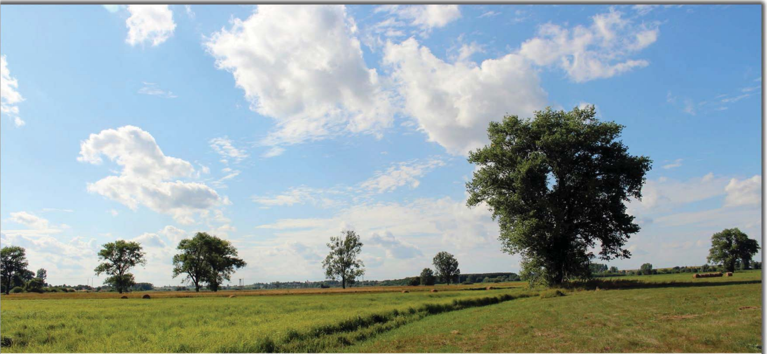
Helyi oltalom alatt áll a Dombóvári tűzlepkés rétek természetvédelmi terület