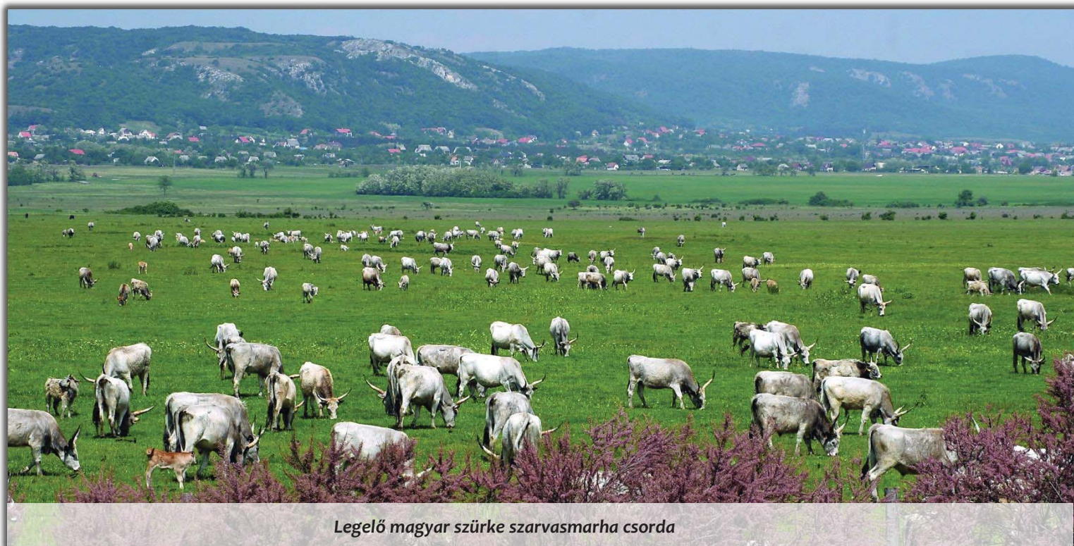
Legelő magyar szürke szarvasmarha csorda