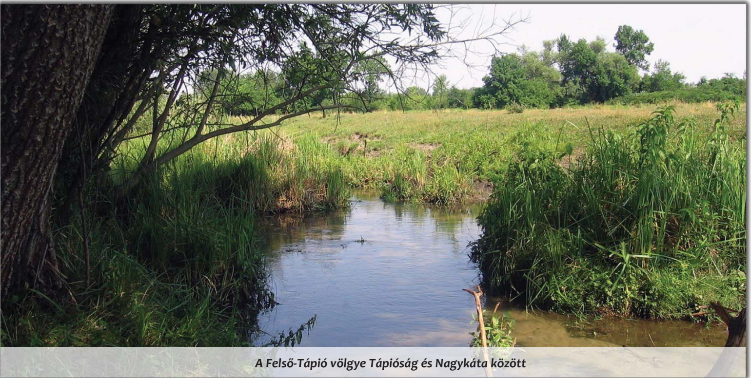
A Felső-Tápió völgye Tápióság és Nagykáta között