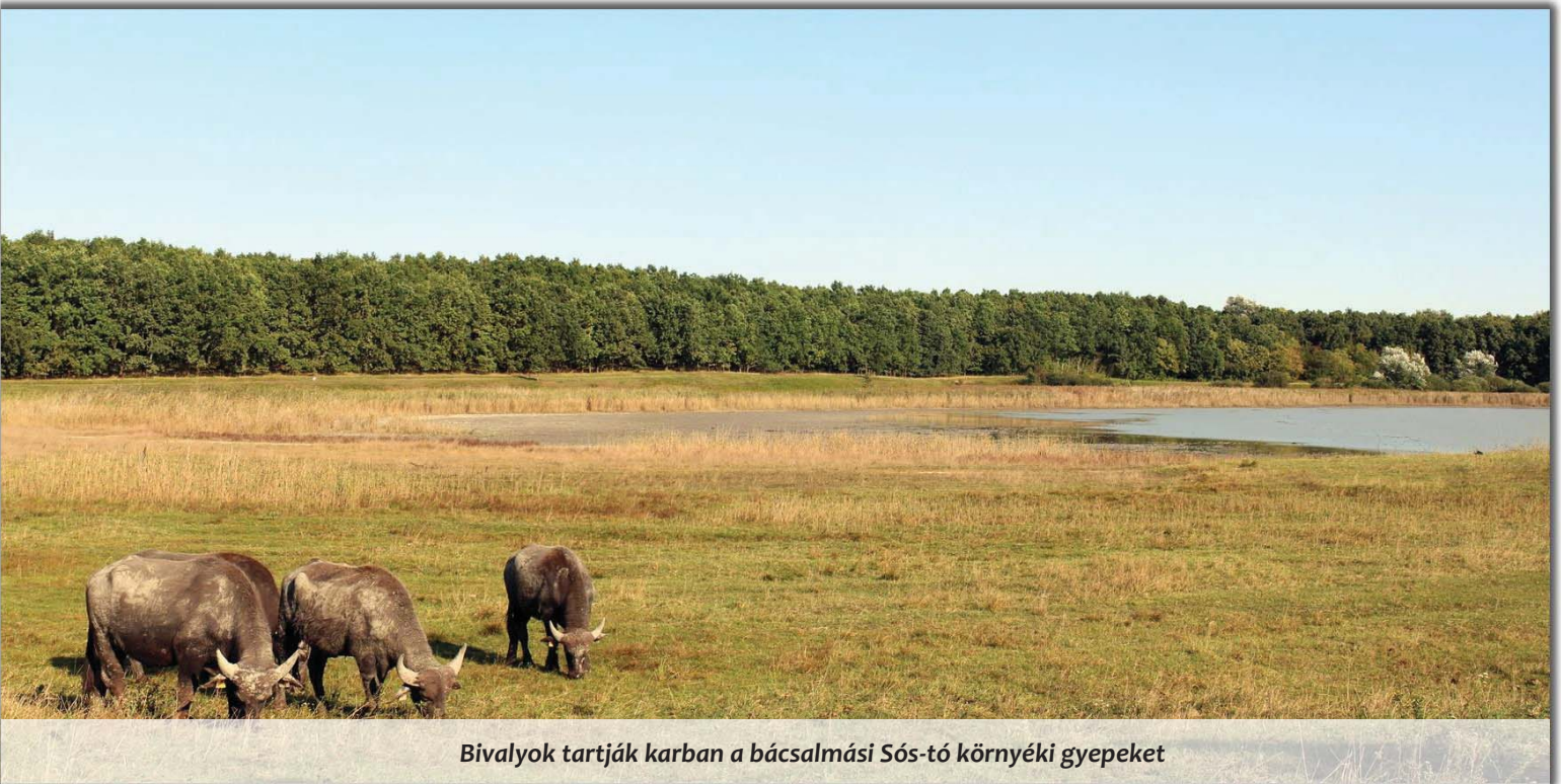
Bivalyok tartják karban a bácsalmási Sós-tó környéki gyepeket