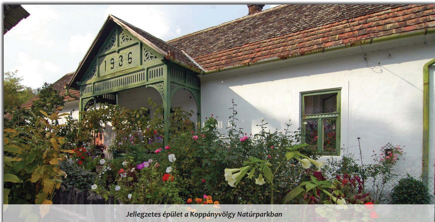
Jellegzetes épület a Koppányvölgy Natúrparkban