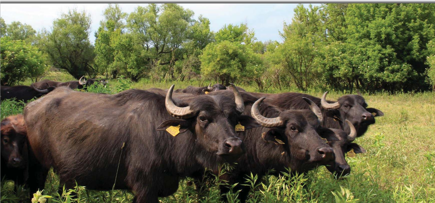
Az őrjegi táj hagyományos karakterének fenntartását bivalyok segítik