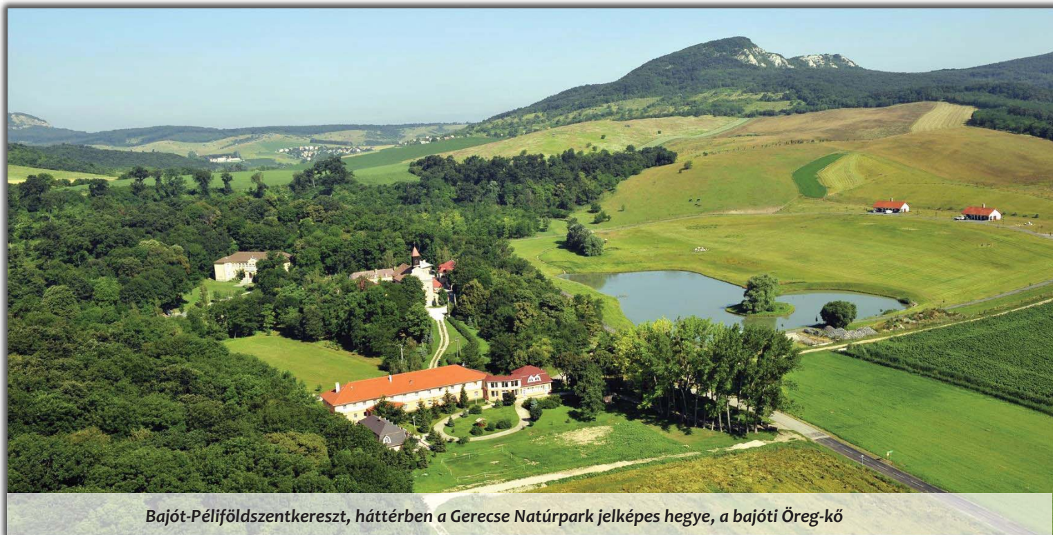
Bajót-Pélföldszentkereszt, háttérben a Gerecse Natúrpark jelképes hegye, a bajóti Öreg-kő