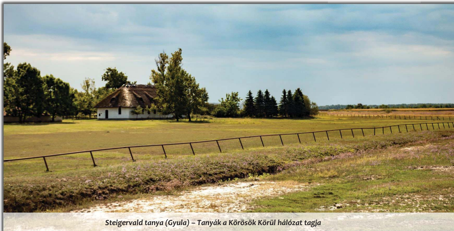
Steigervald tanya (Gyula) – Tanyák a Körösök Körül hálózat tagja